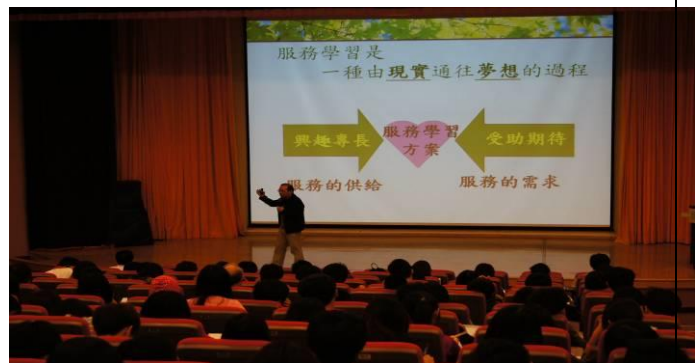
演 講 中