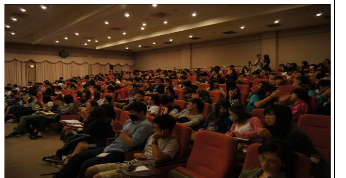
聽 講 中