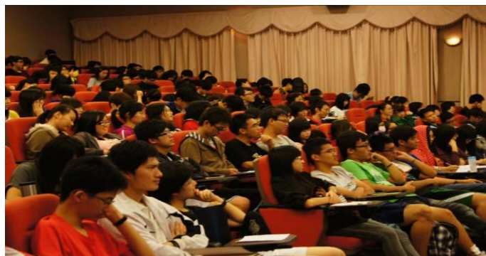
聽 講 中