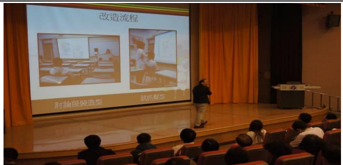
演 講 中